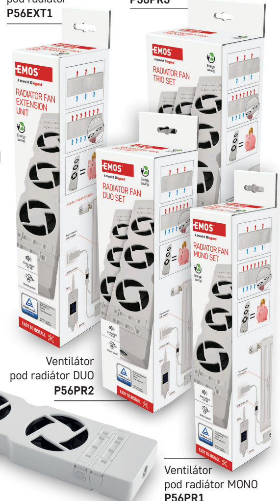
Ventilátor pod radiátor DUO P56PR2